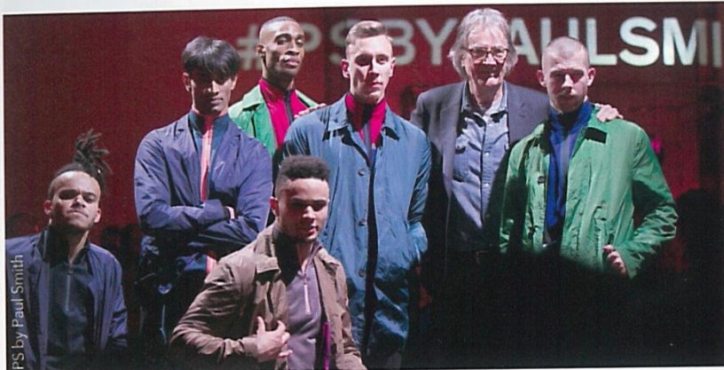
PS by Paul Smith