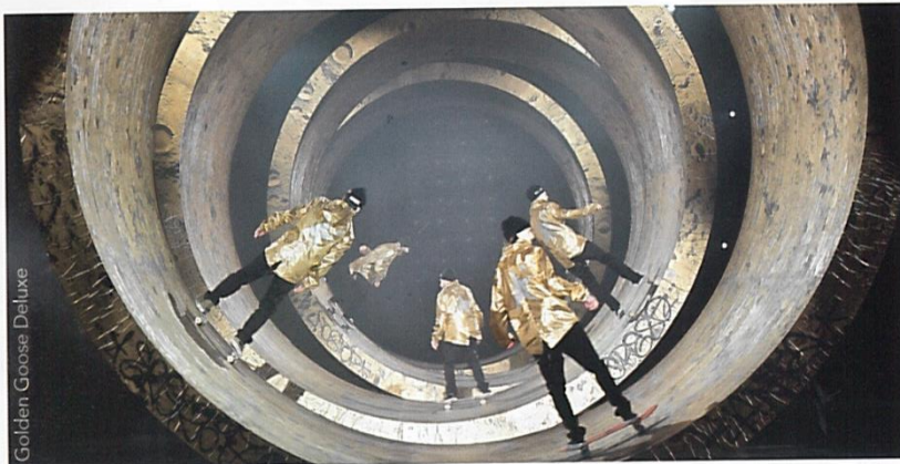
Golden Goose Deluxe