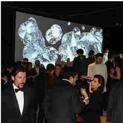
L'evento all'ex Manifattura Tabacchi

Pitti trasforma la città. Non soltanto la Fortezza, ma anche palazzi storici, luoghi d'arte, strade e piazze del centro, pronti a cambiare la propria fisionomia per ospitare presentazioni, sfilate, feste e cocktail a tema che renderanno quella fiorentina una "fashion week" a tutti gli effetti. Se ieri, ad aprire le danze, sono stati l'ex Manifattura Tabacchi, che ha aperto un'area di 400 metri quadri, mai vista finora, alla festa di "Firenze4Ever", l'ormai tradizionale raduno di fashion